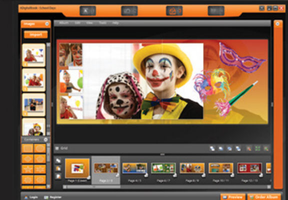
( Thematic Templates )